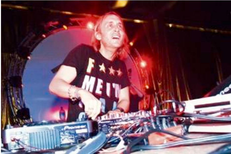
Vendredi, David Guetta était la star de la soirée au festival Sundance.