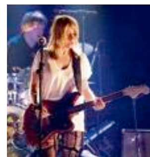
Sonic Youth a assuré lors du Kilbi Festival. sven de almeida

Samedi, les Britanniques de Tunng, connus pour le tubesque «Bullets», ont